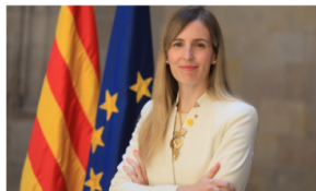
Paraules de Victòria Alsina , consellera d'Acció Exterior i Govern Obert de la Generalitat de Catalunya