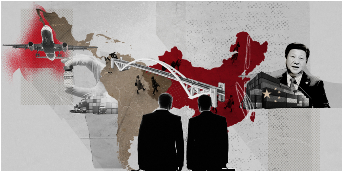
Il·lustració: Sr. García

L'any 2001, la Xina es va unir a l'Organització Mundial del Comerç (OMC), cosa que va suposar un nou començament per obrir-se encara més. Els vint anys posteriors a l'adhesió a l'OMC són fonamentals per al ràpid desenvolupament econòmic i el creixement en el poder mundial d'aquest país, i també suposa un període per integrar-se profundament en el món i compartir oportunitats de desenvolupament. L'Amèrica Llatina i el Carib (en endavant, l'Amèrica Llatina) tenen una forta afinitat amb els països occidentals a causa del seu patrimoni historicocultural. Pel que fa a la riquesa dels recursos, l'Amèrica Llatina es va incorporar abans al sistema econòmic internacional. A més, els interessos econòmics i les relacions d'aquesta regió amb Espanya, la Gran Bretanya, els Estats Units, Alemanya i altres països europeus i americans estan molt arrelats.