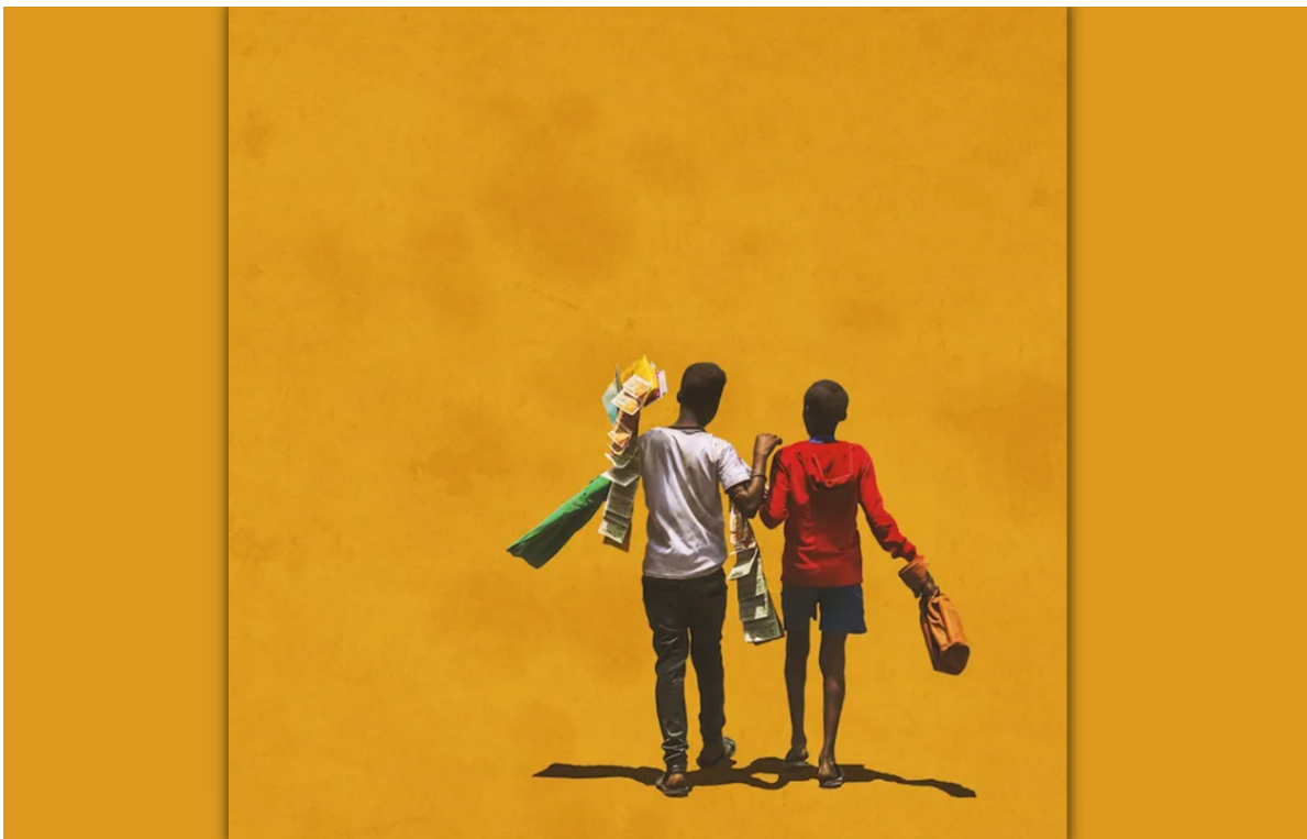
Fotografia: "Moving Shadows II, X", Girma Berta

Parlar de l'estat de la democràcia a l'Àfrica en poc menys de tres mil paraules és tot un repte perquè no existeix una «democràcia africana» pròpiament dita. De fet, a cap altra regió del món el grau de la qualitat democràtica no varia tant com al continent africà. Segons els índexs d'avaluació de la democràcia més utilitzats, l'Àfrica compta amb molt poques democràcies de bona qualitat i amb alguns règims autoritaris, de manera que els sistemes polítics de la majoria de països es troben en un punt intermedi en què es combinen elements democràtics i autocràtics.