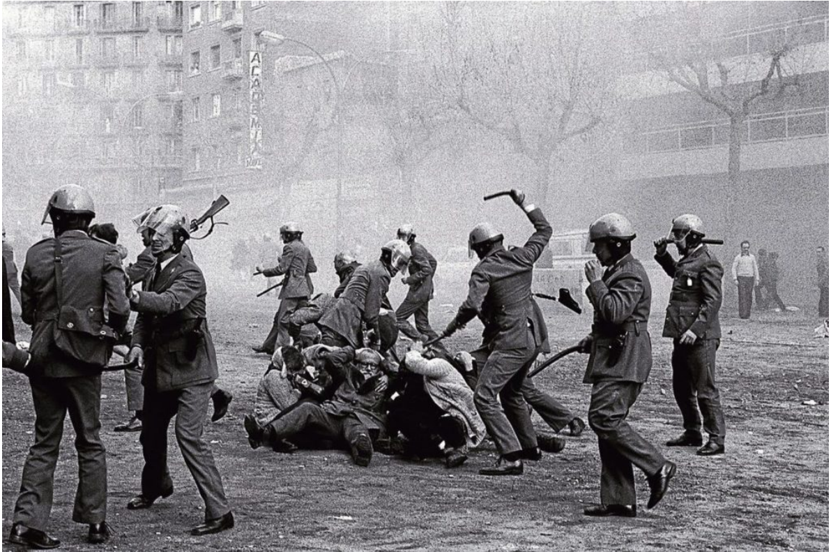
Fotografía de Manel Armengol sobre la represión policial en Barcelona en 1976, durante la Transición

Aquel fuerte deseo popular de reencontrarse en el espacio público, de ser visibles en la calle sin una mano de hierro acechando, se convirtió en la palanca generadora de un nuevo relato, poco tiempo después conocido como “modelo Barcelona”, cuyo eje era la posibilidad de combinar con éxito identificación local, desarrollo económico y cohesión social.