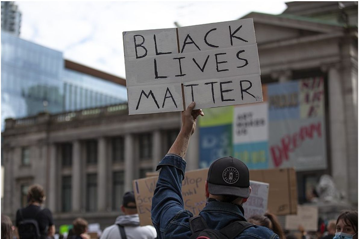
Un manifestante alza un cartel con el lema «Black Lives Matter».