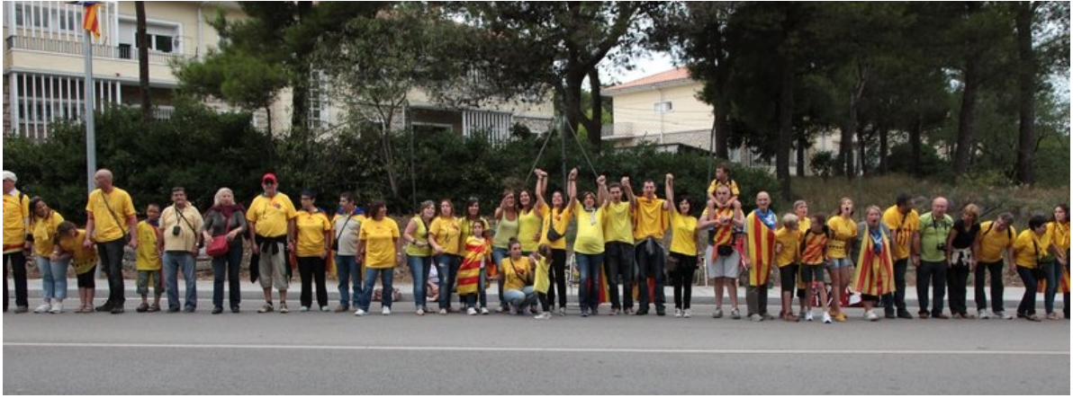
Imagen de la Vía Catalana, en el año 2013, en el tramo 675 en Figueres. La Gigafoto incorporó 107.000 fotografías como ésta.

Hoy el latido de los cuerpos sobre el asfalto ya no puede desligarse de su correlato virtual. La información circula de la calle a la red y viceversa, retroalimentando ambas esferas, potenciada por la cada vez mayor conectividad de los dispositivos individuales y su amplísima capacidad de registro visual.