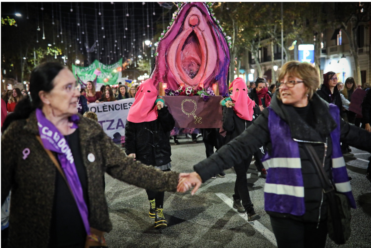
"Procesión del Coño Insumiso", en Barcelona, durante la manifestación contra la violencia machista del año 2019.

Detengámonos un momento ante el fulgor de docenas de iglesias ardiendo en Barcelona, en 1909. De la destrucción sistemática de las imágenes sagradas por parte de los quemaconventos durante la llamada Semana Trágica, algo nacía. Entre las ruinas humeantes de aquellos templos, derribados por la furia popular, empezaba a construirse una nueva sacralidad visual a través de la fotografía