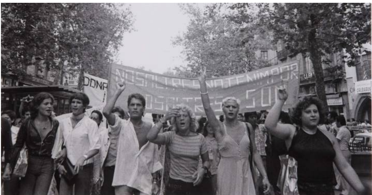
Imagen de la primera manifestación del colectivo LGBT en España, llevada a cabo en Barcelona el 26 de junio de 1977

Durante el franquismo, la bota militar y la parafernalia católica habían dominado abrumadoramente la escena, aunque ni en sus años de plomo dejó de haber protestas populares, “relámpagos en el agua” de las que, en líneas generales, poco se sabe. No se ha conservado de ellas prácticamente ninguna imagen. La clandestinidad obligaba a actuar a toda velocidad y con máxima discreción. No es casual que las protestas que corroboraron la caída del régimen, - Pro-Amnistía 1976, Diada 1977, contra las violaciones 1977, homosexuales, 1977- fuesen, ampliamente fotografiadas. Las fotos eran como una conjura, rompían décadas de silencio y opacidad. Algunas, como las tomadas por Pilar Aymerich o Manel Armengol, que logró difundir en la prensa internacional la dureza de la acción represiva de los grises, constituyen verdaderos iconos de la llamada Transición y han establecido un paradigma visual sobre cómo fue la recuperación popular de las calles tras cuarenta años de dictadura.