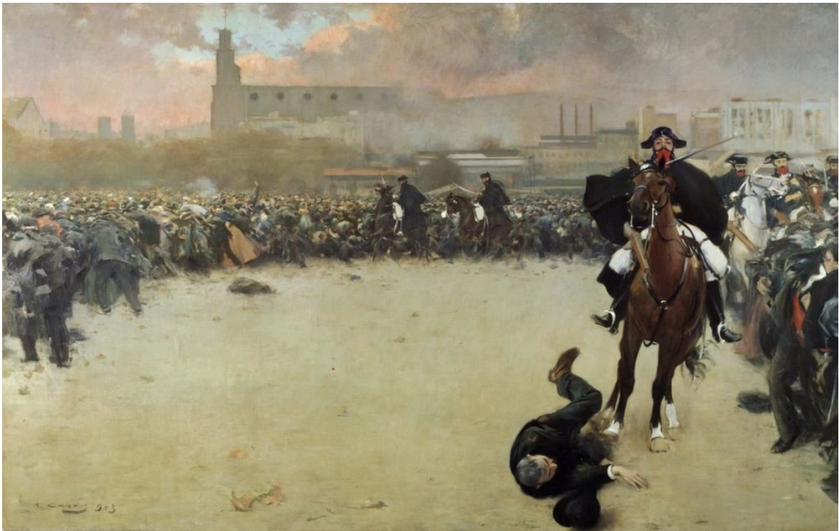
La càrrega , de Ramon Casas (1903).

Tras un largo tiempo, siglos, donde la acción represiva y la punición eran espectáculos ejemplarizantes a la vista de todos, hubo a finales del XIX un movimiento pendular a partir del cual el monopolio de la violencia por parte del Estado tendió a ocultarse, a llevarse con un grado cada vez mayor de discreción. Así, la historia del conflicto social a partir de entonces estaría determinada por aquellas imágenes que pueden o no pueden verse, que solo son visibles veladamente o que son puestas masivamente en circulación si el poder así lo decide.