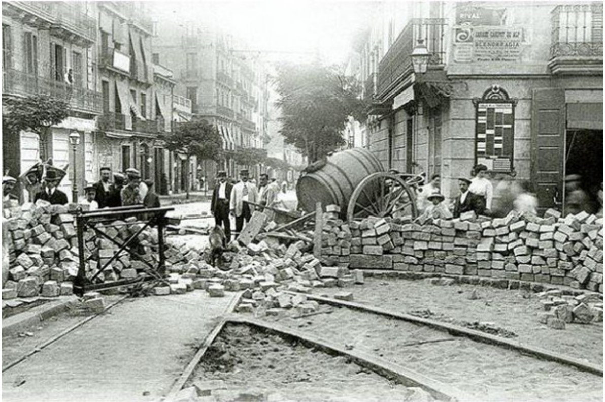
Varias imágenes de calles, edificios y templos de Barcelona durante la Semana Trágica (1909)