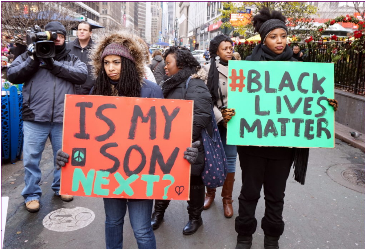
Acción de protesta del movimiento Black Lives Matter en Nueva York.

En el caso del movimiento antirracista, la multiplicación ad infinitum de la visualidad, la saturación de la circulación de imágenes facilitada por la capilaridad digital, ha llegado a hacer estallar en mil pedazos la esfera comunicativa de la propia reivindicación. En las redes, influencers promoviendo campañas de apoyo al movimiento a través de escenificaciones racistas como el blackface , y en las calles torrentes de selfies , posados o pases de modelos, usando la fuerza visual de las multitudes como mero decorado.