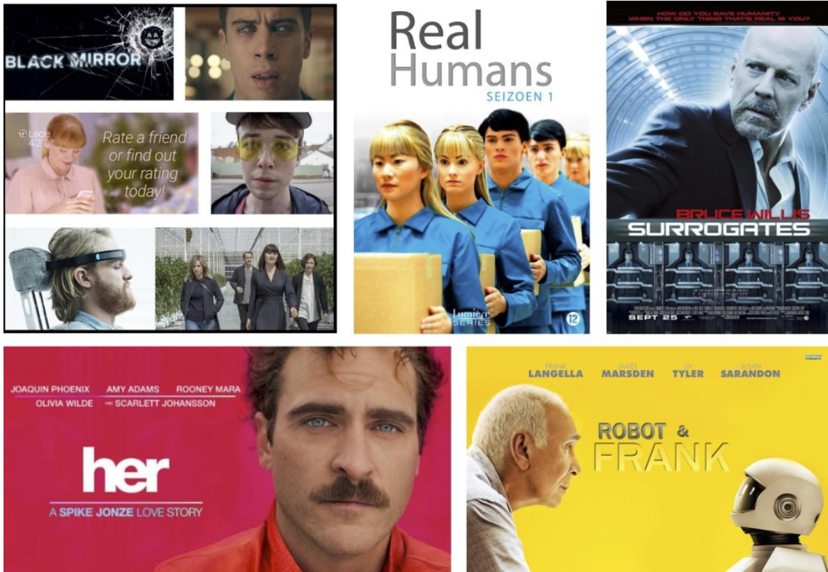
Figura 1. Series y películas de ciencia ficción que tratan cuestiones éticas generadas por las tecnologías digitales, especialmente la IA y la robótica.

En cuanto a libros pensados para la enseñanza de cursos de ética en grados tecnológicos a través de la ciencia ficción, resaltaría los de Murphy [12], Nourbakhsh [13] y Torras [14]; ver en la figura 2. El editado por Murphy cuenta los principios clave de la IA; los relatos que incluye -de Asimov, Vinge, Aldiss i Dick- tratan sobre las cuestiones de la telepresencia, la robótica especializada en la imitación del comportamiento, la deliberación, la validación, la interacción robot-humano, el valle inquietante, el procesamiento de lenguas naturales, el aprendizaje automático y la ética. Cada narración es precedida por una nota introductoria, 'Mientras lees', y va seguida de una discusión sobre las posibles derivadas, 'Después de la lectura'.