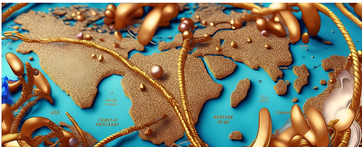
Micropartículas cuánticas doradas sobre un mapamundi. Conceptualización: Luisa Quiroga

Las previsiones del mercado para la década que viene sitúan las tecnologías cuánticas en el centro del crecimiento económico. McKinsey, por ejemplo, predice que el año 2035 el impacto de la informática cuántica por sí sola llegará a los 1,3 billones de dólares, y se espera que los servicios financieros y la industria química obtengan los principales beneficios. [1] Las tecnologías cuánticas se basan en los principios de la mecánica cuántica y ofrecen niveles de cumplimiento sin precedentes que permitirían avances en la investigación científica, las aplicaciones industriales y la seguridad nacional.