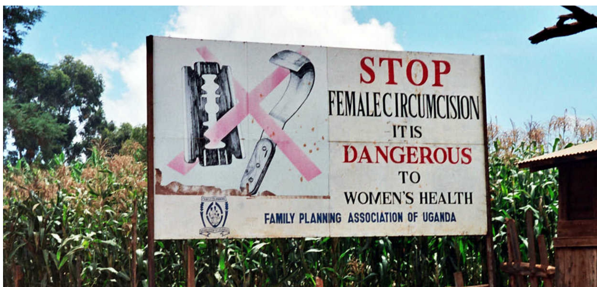
Campanya contra la mutilació genital femenina a Kapchorwa, Uganda.