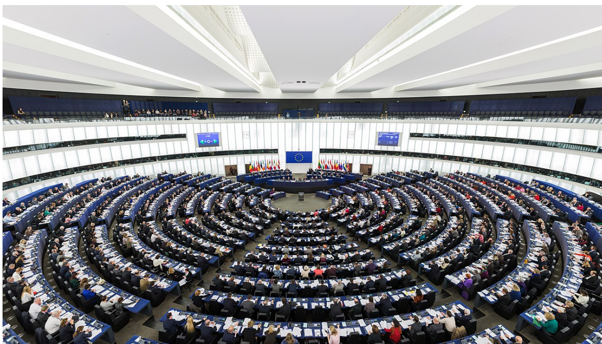
Vista del Parlament europeu

Anàlisi dels resultats de les eleccions al Parlament europeu