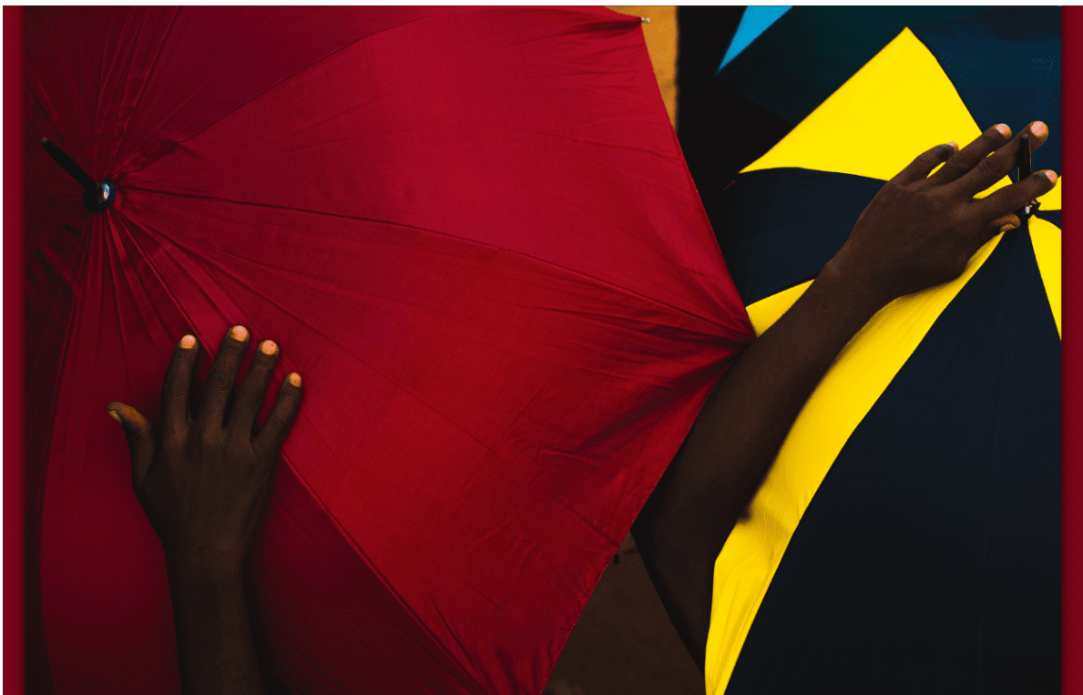
Fotografia: "So that we are not erased", Obiageli Adaeze Okaro

Mentre el continent africà pateix encara les conseqüències econòmiques i socials de la pandèmia, el procés d'establiment de l'Àrea de Lliure Comerç Continental Africana (AfCFTA) continua. Són moltes les ambicions de l'AfCFTA, entre les quals es troben l'augment del comerç intraregional, el foment de la industrialització o la creació d'ocupació. La posada en marxa de l'àrea de lliure comerç, operativa el gener de 2021 malgrat la pandèmia, suposa una fita històrica en el procés de la integració panafricana. En el context actual marcat per les importants dificultats —encara que també per l'inici de la recuperació—, l'AfCFTA es posiciona a l'agenda africana com un instrument clau per a crear mercats més competitius i fomentar el desenvolupament econòmic i social del continent.