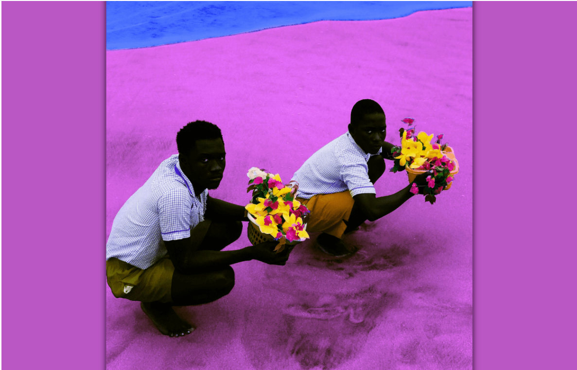
Fotografia: "Our heart speaks in Flowers", Derrick Ofosu Boateng

L'abril de 2018, quan Abiy Ahmed va ser designat primer ministre per l'EPRDF (sigles en anglès del Front Democràtic Revolucionari Popular Etióp), la coalició de partits en el govern des de 1995, Etiòpia va semblar obrir-se a una possible transició. Tanmateix, la nit del 3 al 4 de novembre de 2020 començava un conflicte armat entre el govern central i el govern de la regió del Tigre. L'esclat de la guerra civil va semblar truncar el començament de la transició i va obrir un nou capítol en la història de la República Democràtica Federal d'Etiòpia (RDFE).