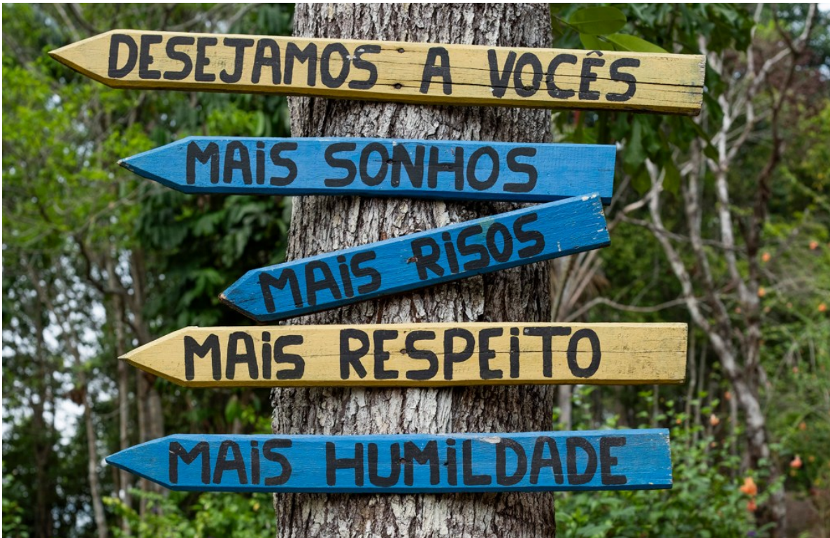
La comunitat indígena Kambeba.